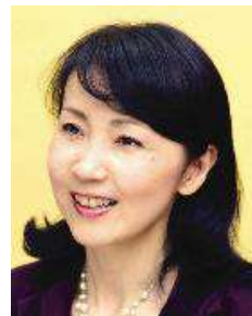
岸本葉子 エッセイスト