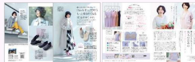
スケッチャーズTU 檀れいさん起用

圧倒的に知名度のある40～50代の著名人を起用したタイアップが可能です。同世代の、前向きな生き方に共感を呼ぶ著名人のキャスティングはお任せください。