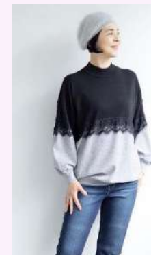
ファッションセンターしまむら ×「大人のおしゃれ手帖」 ×「素敵なおの人」 コラボブランド「hareiro ～晴れ色～」