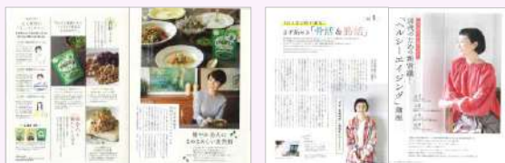
カルビー「ミーノ」TU × 巻頭「ヘルシーエイジング」特集

編集特集記事との連動タイアップが好評です。特にヘルスケアや健康を意識した商品では特集からタイアップへと自然な流れで掲載。特集内でも商品フォローができるため、商品理解がより深まり、自然に訴求できるのが魅力です。