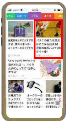
※配信イメージです