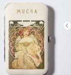
雑誌付録初のミュシャのアート入り2版。