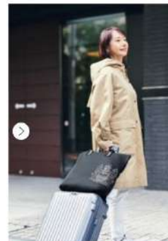
11月28日発売GLOW2025年1月号の