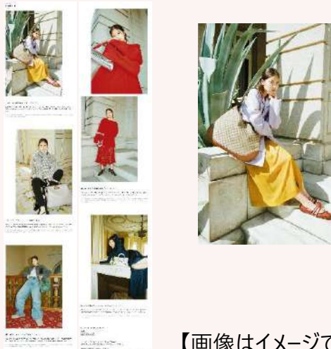
【画像はイメージです】