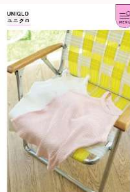
「販売しているというカップ付きのアメリカはさまのタオリティ。カウパリで欲しい! (STY伊藤さん)」