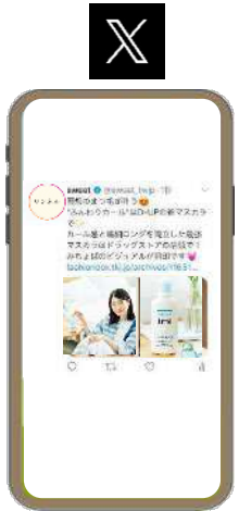
※配信イメージです

Xのタイムラインに画像や動画で掲載される広告です。特定のキーワードをポストしているユーザーや、特定のアカウントをフォローしているユーザーなど、様々なターゲット設定で配信可能です。