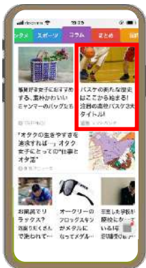
※配信イメージです