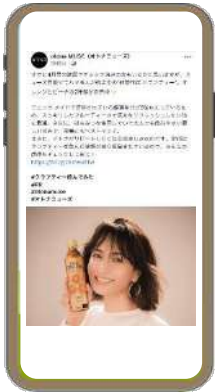
※配信イメージです